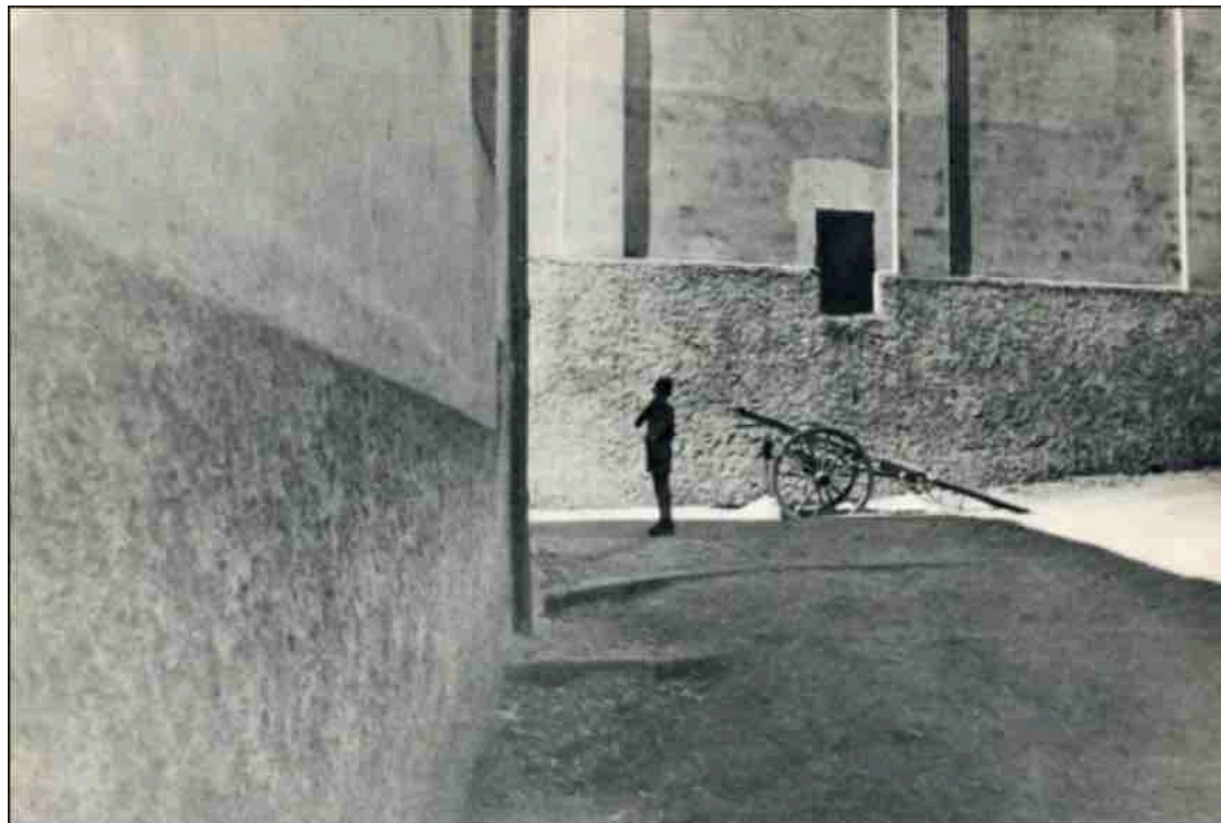
Salerno, Itália, 1933