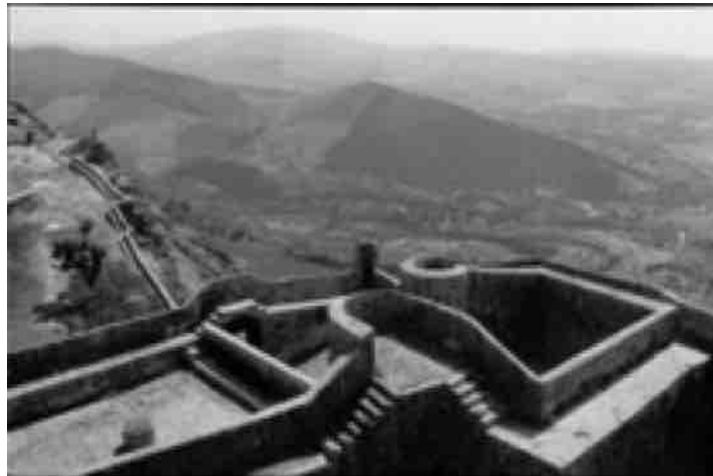
Marvão, Portugal, 1955