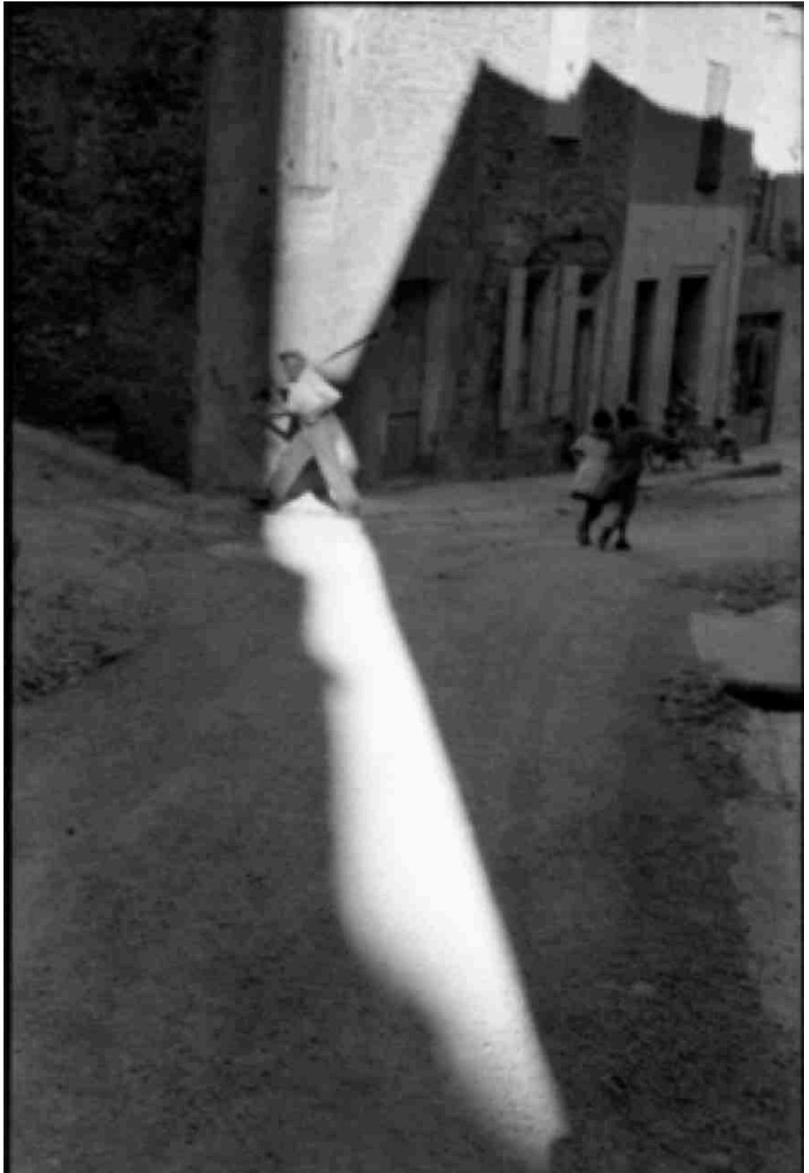
Tarascon, França, 1959