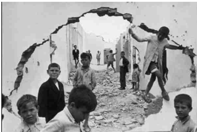
Sevilha, Espanha 1944