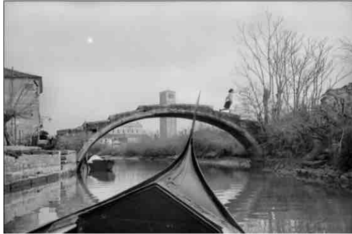
Torcello, Italia, 1953