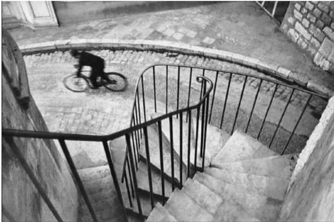
Hyères, França, 1932