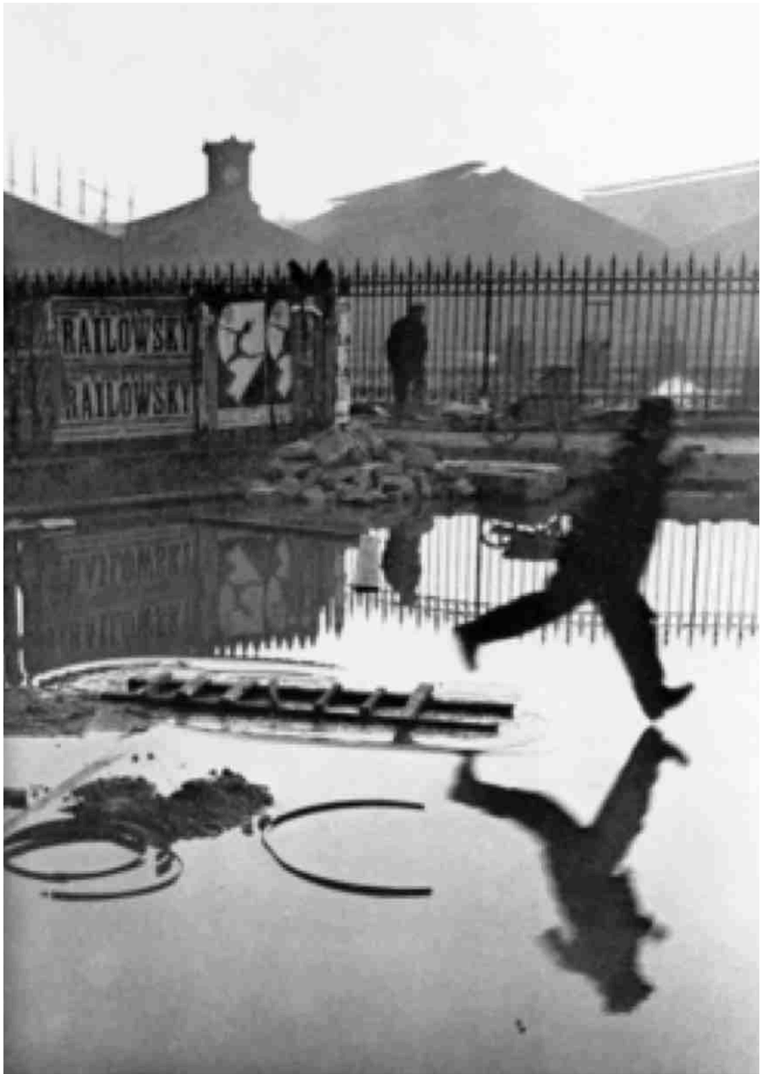
Pont de L'Europe, Paris, França, 1932