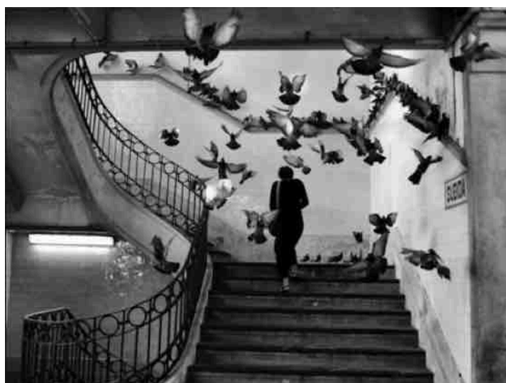
Mercado do Bolhão, Porto, Portugal, 1955