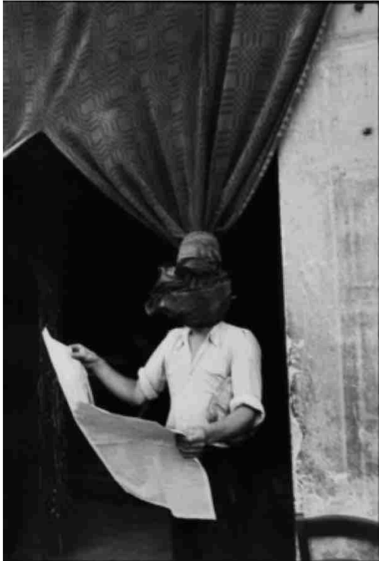
Livorno, Itália, 1933