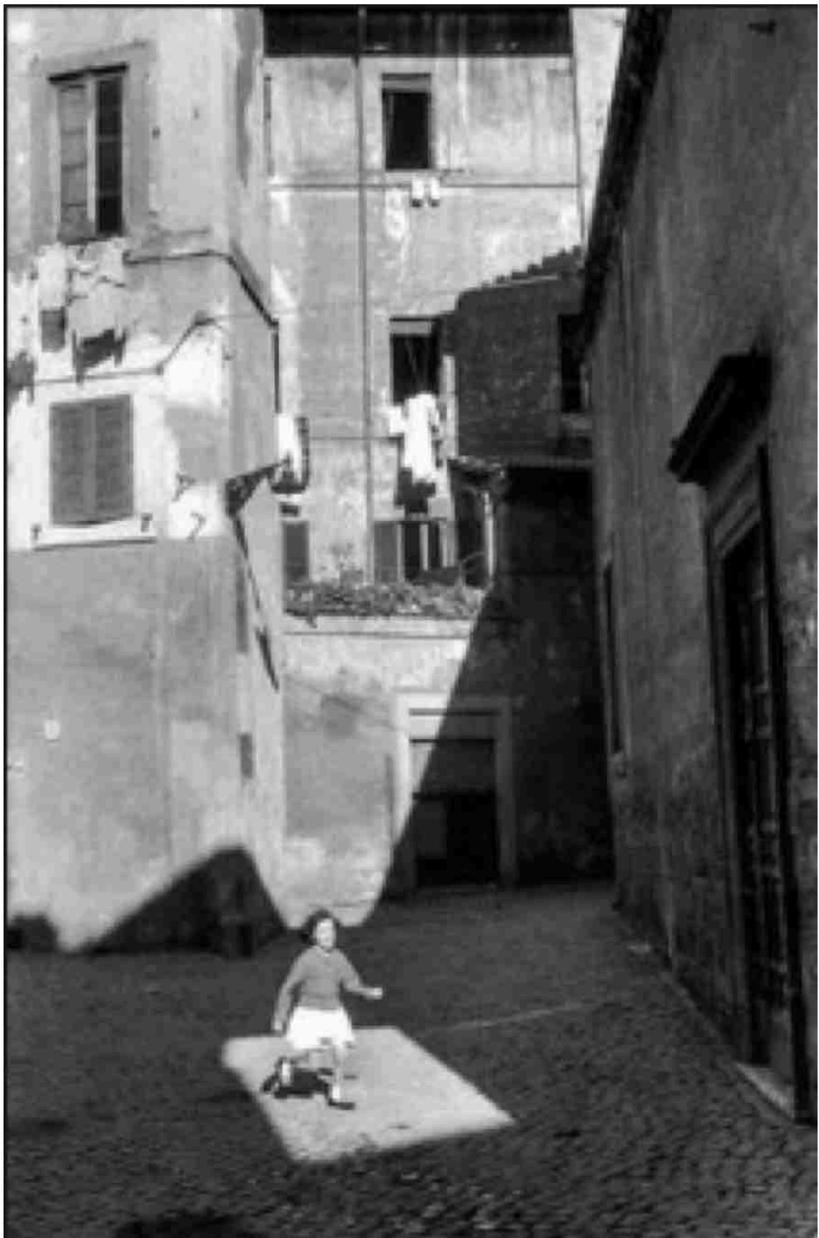
Trastevere, Roma, Itália, 1959